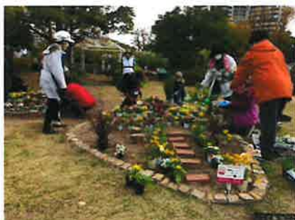
▲ 子どもたちと一緒に楽しむ花壇