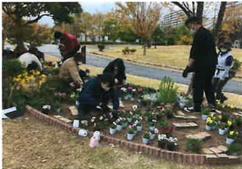
▲ ストレスを解消する花壇

講座を終えた受講者の方から「受講して本当に良かった」「植物のことやデザインの基本が理解できた」「もう少し時間の余裕が欲しかった」などの感想がありました。受講生の中には園芸福祉ふくおかネットに入会された方もおられます。2月11日(土)に実施された初級園芸福祉士認定試験にはスタッフとして、一生懸命試験に取り組んでいる姿を見守りました。今後、受講者の皆さんと共に園芸福祉の輪を更に大きく広げて参りましょう。