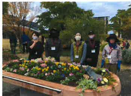
▲ 車椅子利用の人たちと一緒に楽しむ花壇