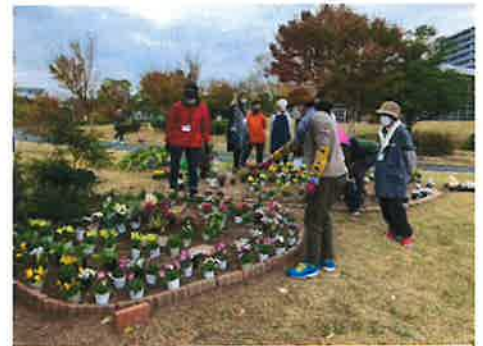
▲ 高齢者の人たちと一緒に楽しむ花壇