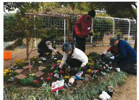
▲ 視覚に障がいのある人たちと一緒に楽しむ花壇